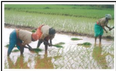
La agricultura recurso principal de las mujeres para sacar sus familias adelante.

A LO LARGO DEL CURSO DARÁN LUGAR LAS SIGUIENTES INICIATIVAS SOLIDARIAS: